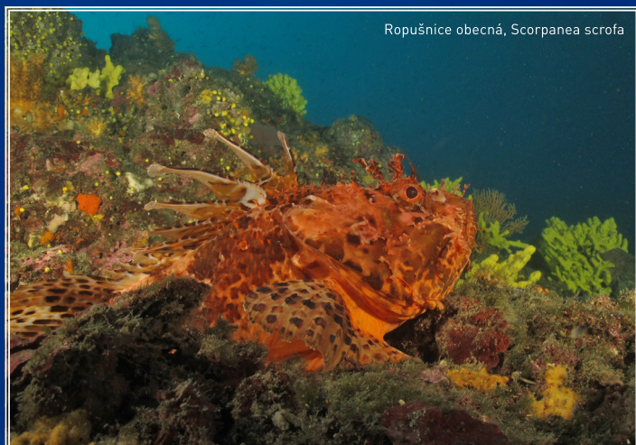
Ropušnice obecná, Scorpanea scrofa

Je pravda, že velké ryby vymizely, kanice nevidno už pár desetiletí a místňáci si stěžují, že musí lovit hlouběji a hlouběji s menším a menším úspěchem. Je to bohužel důsledek „volné ruky trhu“.