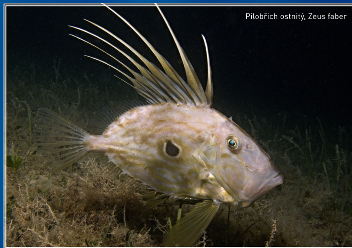
Pilobřích ostnité, Zeus faber

Mezi další pozoruhodnosti patří vraky , kterých je u břehů Jadranu velké množství díky členitému pobřeží, zimním bouřím a válečným aktivitám. Stačí se podívat na web, zeptat se rybářů nebo místní potápěčské základny. A najdou i takové kuriozity jako potopení vlastní minou, opilí námořní-