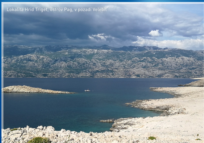
Lokalita Hrid Triglet, ostrov Pag, v pozadí Velebit

Přemýšlíte, kam byste se díky uvolňujícím se opatřením vydali? Nejlépe do teplého čistého moře. A nejbližší je právě dostupný Jadran. Nezávisí na leteckém provozu, na severní část stačí prodloužený víkend, jižní se hodí na celý týden nebo dva, tedy potápěčská dovolená. A Češi budou zřejmě mezi prvními turisty, jak tomu bylo za první republiky nebo po válce Domovinski rat v půlce 90. let.